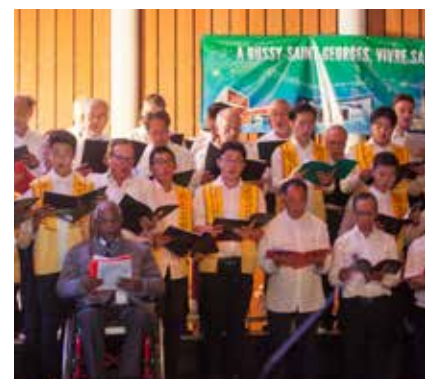
Gala pour la Paix 2015

Nous sentons bien à Bussy Saint-Georges, à travers cette expérience de l'Esplanade des Religions et des Cultures, que nous sommes tous, dans nos différentes communautés, au diapason pour promouvoir la justice et, en conséquence, protéger l'enfant et ses droits naturels qui sont des droits fondamentaux ●