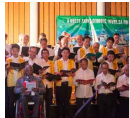
Gala pour la Paix 2015

Au-delà, de par le monde, et pour de multiples raisons, des millions d'enfants ne sont pas déclarés à l'état civil, en contradiction avec l'article 7 de la CIDE. L'UNICEF dénombre 230 millions d'enfants dans ce cas. Ils sont directement menacés par des chefs de guerre, de bandes du crime organisé qui profitent de leur difficulté à être scolarisés.