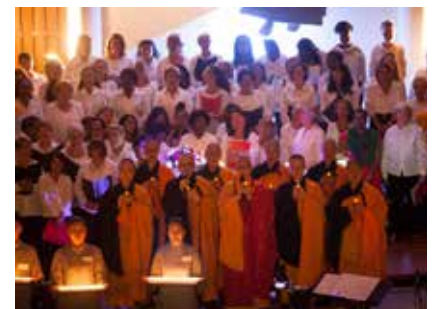
Gala pour la paix 2018

L'Esplanade des Religions et des Cultures est une expérience incroyable et j'en suis fier car nous incarnons des valeurs qui peuvent être érigées en modèle de partage et de communication. En 2019, toutes les communautés avaient organisé une course pour l'Amazonie, pilotée par des jeunes des différentes communautés. Je m'attendais à ce que cela se passe bien entre nos jeunes, mais pas à ce que de véritables liens se créent et perdurent, comme cela a été le cas. C'est formidable ! Il faut continuer en organisant des activités communes où les enfants catholiques, protestants, musulmans, bouddhistes, hindous, juifs, non-croyants et bien d'autres se mélangeraient (tournois sportifs, représentations culturelles, etc.). C'est vraiment en faisant ensemble que nous arriverons à renforcer et propager cet état d'esprit et nous fondons l'espoir que ce sera celui de demain à Bussy ●