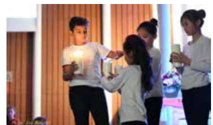
Gala pour la Paix 2018

Les parents, et aussi les adultes des entourages scolaires, des communautés et de la société ont la responsabilité de communiquer avec les enfants, partager avec eux, être attentifs à leurs émotions, compatir avec eux. Il faut les écouter. Ils sont vulnérables. Je citerai un fait relaté dans la Sunna, recueil des paroles du prophète, où ce dernier aperçut un enfant en pleurs. Il lui demanda la cause de ses pleurs : "Mon petit oiseau est mort". Le prophète se retourna vers ses compagnons et dit, d'un ton grave : "Le petit oiseau est mort". Ce qui signifie qu'il faut considérer l'univers affectif des enfants. La justice également est un droit de l'enfant. Il faut le traiter avec justice afin que, plus tard, étant devenu adulte et autonome, il reproduise cette vision de justice.