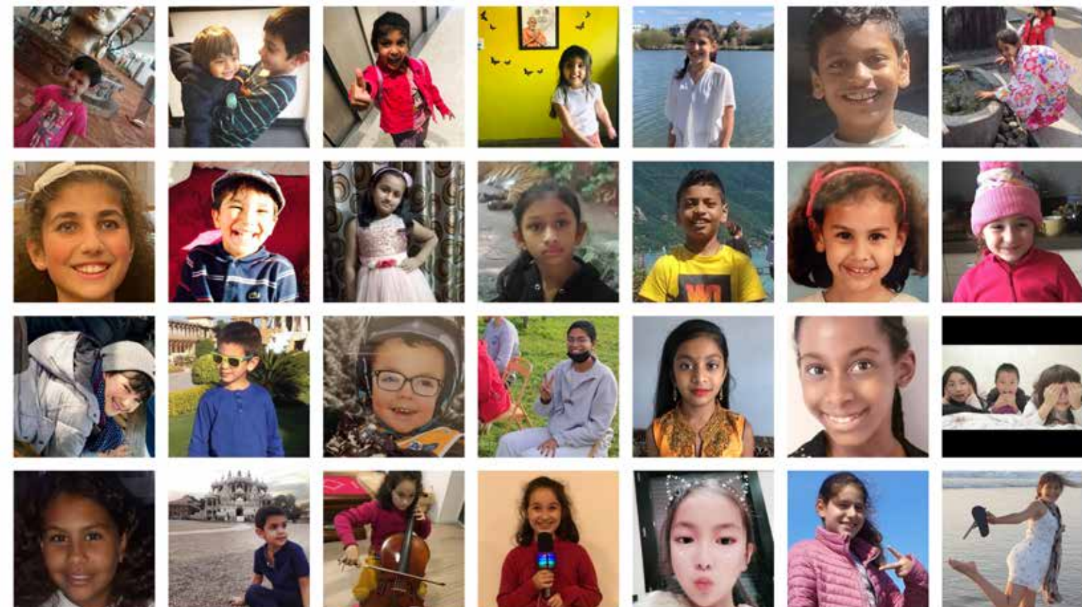
Les enfants de la paix 2021