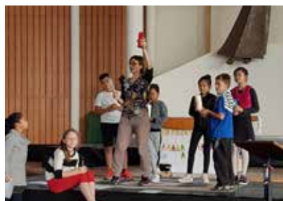
Gala pour la Paix 2018

Cependant, tous les enfants ne vivent pas toujours dans des conditions où ces types d'enseignement peuvent leur être dispensés. Au Brésil, à Taiwan, Fo Guang Shan a accueilli de nombreux enfants miséreux pour leur proposer une éducation qui leur permette de sortir de leur condition. Il ne leur est pas demandé de devenir bouddhistes ou de prier. C'est une action caritative. Fo Guang Shan a mis en place, sur ses propres fonds, des