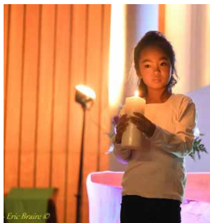
Gala pour la Paix 2018

Nous avons réalisé, avec le concours d'Astrapi (Editions Bayard) des interviews d'enfants à propos de leurs différents droits. L'article 14 de la CIDE qui mentionne le droit à se projeter dans l'avenir et à imaginer son futur librement a été qualifié par beaucoup de jeunes comme l'espace où vivre leur religiosité. "Être croyant, c'est être une personne d'avenir" nous a dit un des enfants interviewés. J'ai trouvé ce propos édifiant.