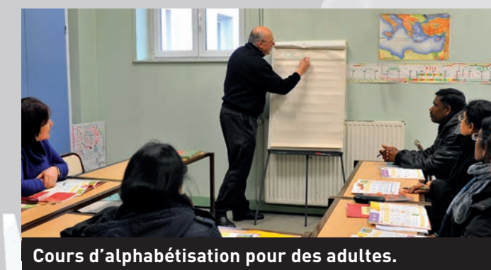
Cours d'alphabétisation pour des adultes.

Ces actions de fraternité sont vécues par les chrétiens en compagnonnage avec leurs amis militants des nombreuses associations de solidarité. Alors même que le législateur a mis en place le « délit de solidarité », ensemble, au coude-à-coude, « ceux qui croient au ciel et ceux qui n'y croient pas » vivent et veulent continuer à vivre cette belle aventure de la fraternité construite avec les migrants, fiers et heureux d'être solidaires ensemble.