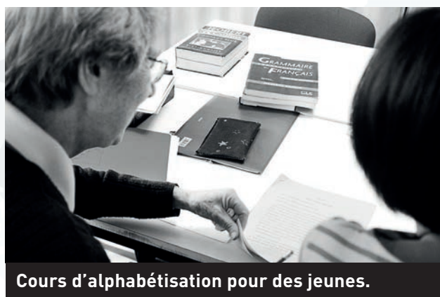
Cours d'alphabétisation pour des jeunes.

Dans le domaine de l'entreprise aussi, on se mobilise. Certains salariés mènent la lutte pour que des travailleurs non déclarés et donc livrés à la surexploitation obtiennent la régularisation de leur statut. « Pour nous, la mort et la résurrection de Jésus ouvre un chemin de libération pour tous les hommes », disent les prêtres-ouvriers.