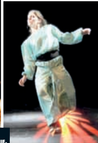
DEUX CRITÈRES DE SÉLECTION : LA TECHNIQUE ET LA CHORÉGRAPHIE.