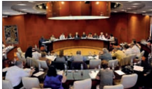
LE CONSEIL S'EST AUSSI FÉLICITÉ DES 15 RÉUNIONS JEUNESSE.