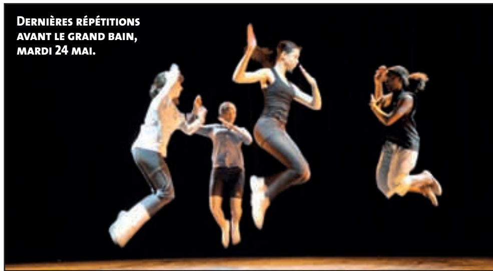
DERNIÈRES RÉPÉTITIONS AVANT LE GRAND BAIN, MARDI 24 MAI.

M ai 1913. Dans les travées habituellement silencieuses du théâtre des Champs-Élysées, on frôle le pugilat. Le public conspue ce qu'on lui sert là, Le sacre du printemps , d'Igor Stravinsky, un ballet en deux actes : L'adoration de la terre et Le sacrifice , évocateurs des rites païens de la Russie. Tantôt fragmentés, les thèmes musicaux se juxtaposent, se télescopent, empruntent parfois aux rythmes africains. La chorégraphie, signée alors de Vaslav Nijinski, heurte tout autant : postures qualifiées de bestiale, pieds en dedans... En rupture totale avec l'académisme de la danse. Une représentation qui fit dire à l'auteur français Jean Cocteau, présent le soir de la première : "Les habitués du ballet russe n'y comprenaient rien ! On ne trouve plus personne qui siffle le sacre aujourd'hui, pourtant tout le monde l'a siffilé". "Force intérieure". C'était il y a près d'un siècle. Depuis, les plus grands chorégraphes ont revisité l'œuvre : Pina Bausch, Martha Graham, Angelin Preljocaj s'y sont exprimés. Cette histoire houleuse, aucun des jeunes danseurs du conservatoire Jean-Wiener (hip-hop, danses classique et contemporaine, modern-jazz, théâtre)